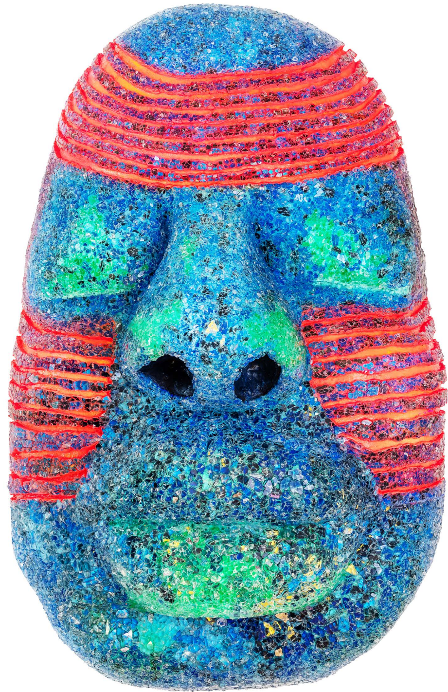
ASHLEY SCOTT BUBI BERLIN · EXODUS FROM HOME, 2020, glass · plaster · acrylic paint 108 x 65 x 31 cm