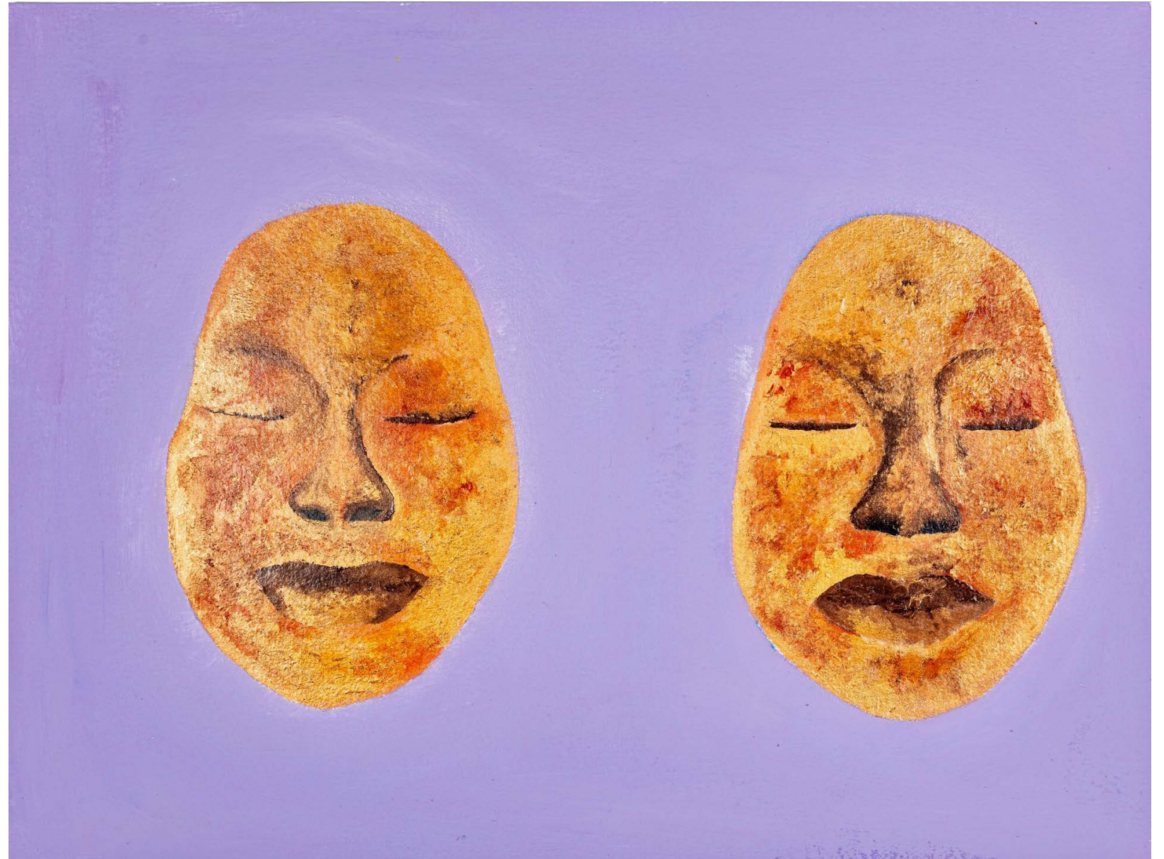
ASHLEY SCOTT BUBI OCHE, 2020, acrylic paint on paper · 36 x 48 cm