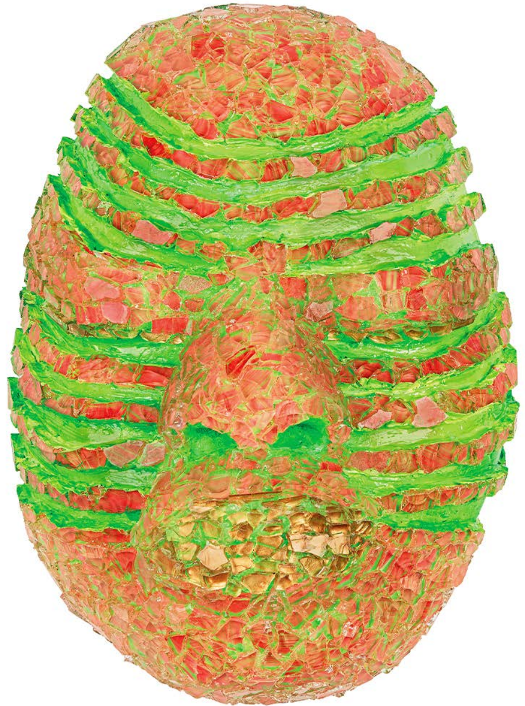
ASHLEY SCOTT BUBI ALABAMA · SLAVERY, 2020, glass · plaster · acrylic paint · 22 x 16 x 9 cm