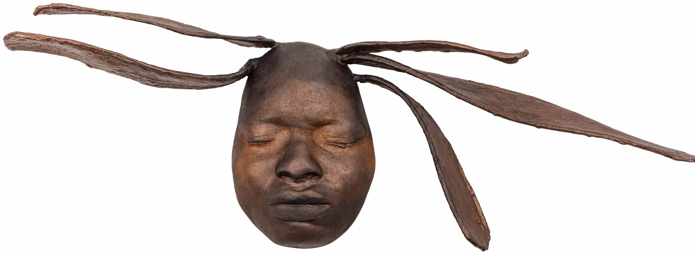
ASHLEY SCOTT GENESIS 1, 2020, resin and acrylic paint. 22 x 64 x 9 cm