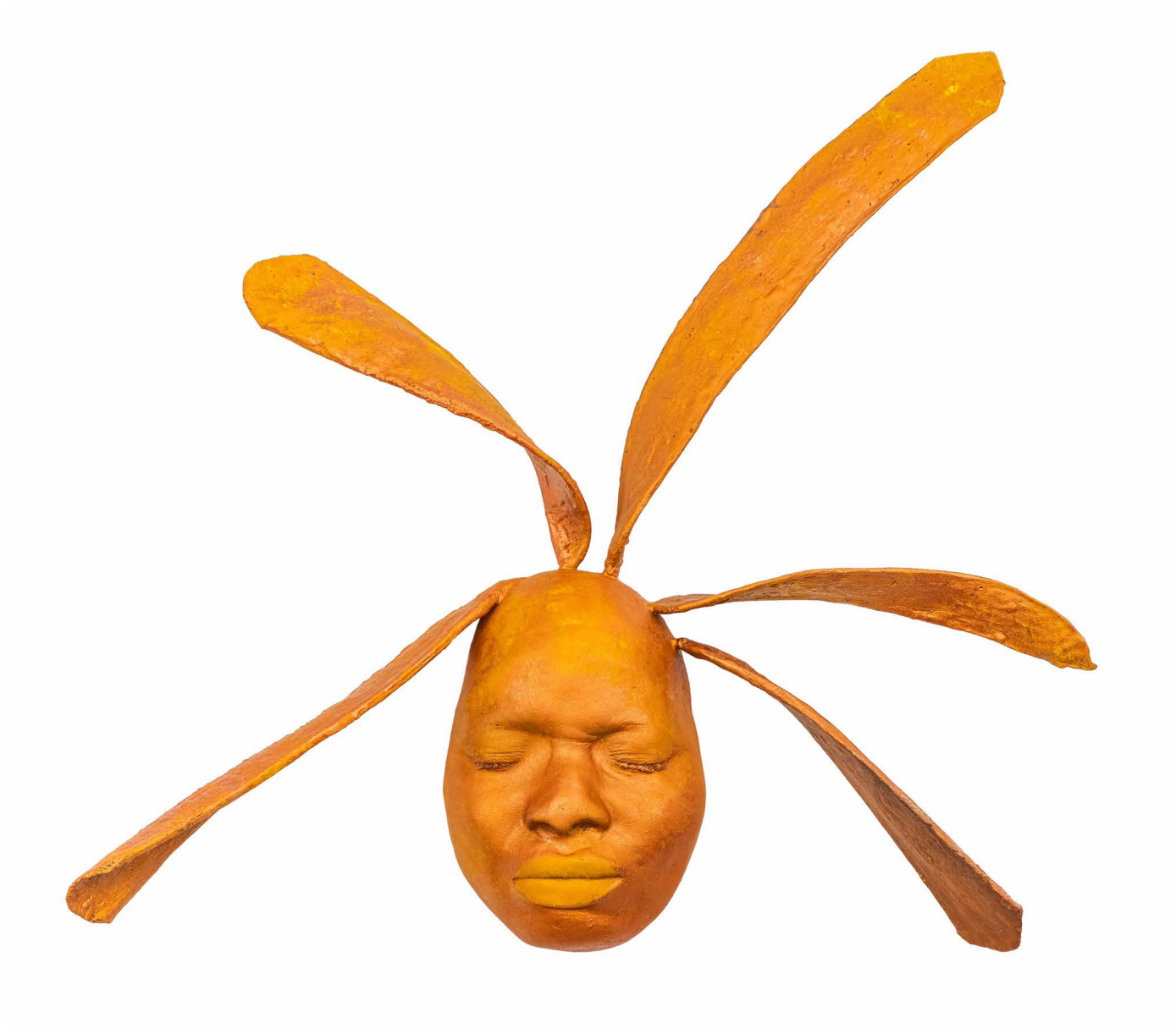
ASHLEY SCOTT GENESIS 2, 2020, resin and acrylic paint. 56 x 57 x 17 cm