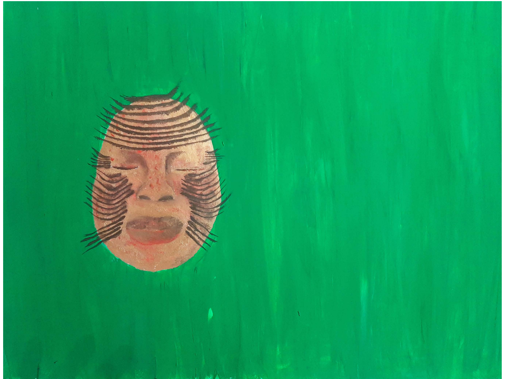
ASHLEY SCOTT BUBI BISLA, 2020 acrylic paint on paper · 46 x 60 cm