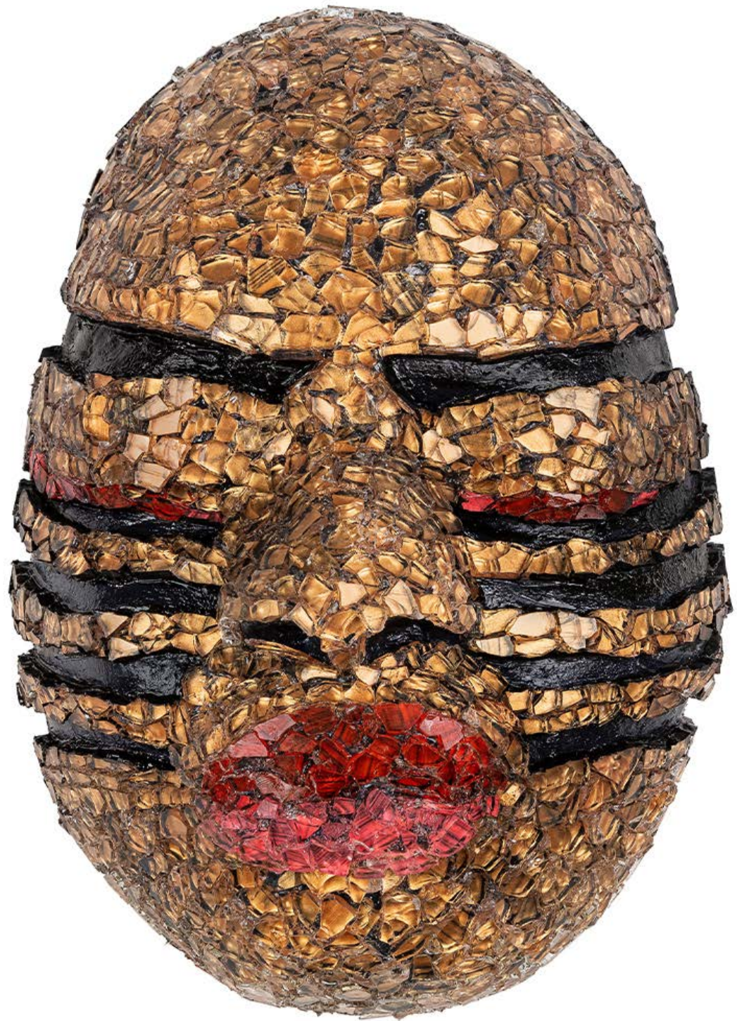
ASHLEY SCOTT BUBI OCHE · THE VOLCANO YEARS, 2020, glass · plaster · acrylic paint · 22 x 16 x 9 cm